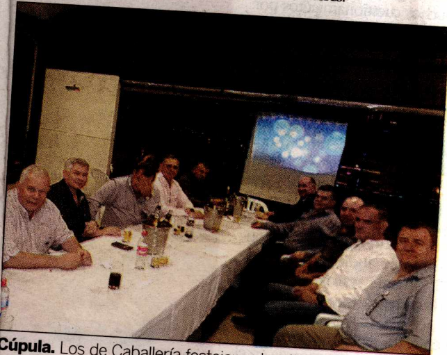
Cúpula. Los de Caballería festejaron las últimas movidas.