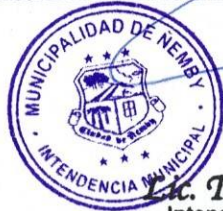
Lic. Tomás Olmedo Intendente Municipal Municipalidad de Ñemby