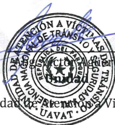
Unidad de Atención a Víctimas

Dirección de Capacitación y Campañas Viales