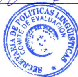
Hernando de Rivera c/ Facundo Machaín N° 5475

Se procede a cargar el Cuadro Comparativo de Ofertas (CUADRO I) en base a la Planilla de Precios presentada por la única empresa participante.