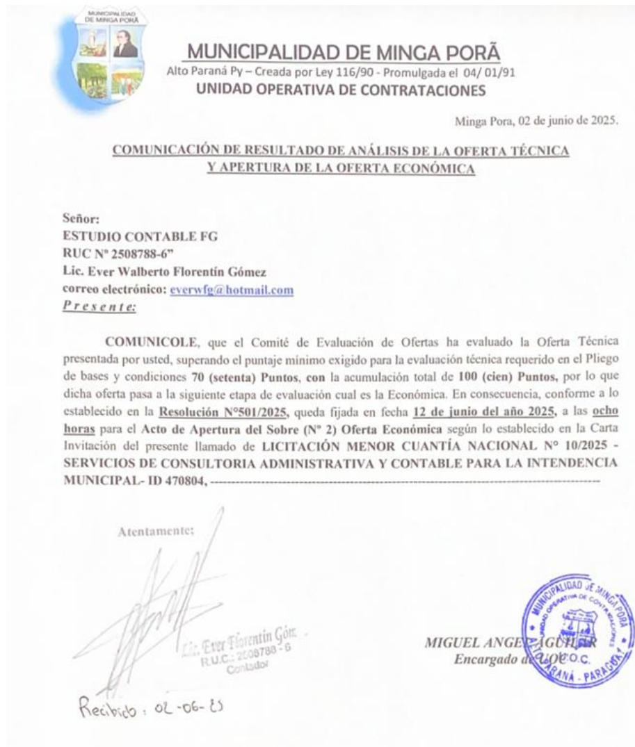
Fig. 1. Facsímil de la notificación realizada en fecha 2 de junio, recibida en la misma fecha.

En esta notificación, la fecha fijada para la evaluación económica fue establecida en fecha 12 de junio de 2025. Sin embargo, en el SICP el proceso fue publicado recién en fecha 03 de junio de 2025, tal y cual como se ve en la imagen: