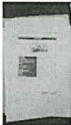
WhatsApp image 2024-11-01 at 13.23.56.jpeg 70K