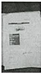
WhatsApp image 2024-11-01 at 13.24.01.jpeg 70K