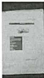
WhatsApp image 2024-11-01 at 13.23.43.jpeg 63K