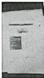
WhatsApp image 2024-11-01 at 13.23.48.jpeg 74K