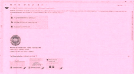
Captura de pantalla 2024-10-10 152016.png 130K