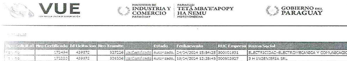
Imagen extraída de la página oficial del MIC, las firmas oferentes, cuenta con el Certificado de Origen

Según se puede apreciar en las ofertas de las firmas 3H INGENIERIA SRL (Certificado N° 172220) y ELEMEC SRL (Certificado N° 172494), presentan el Certificado de Origen.