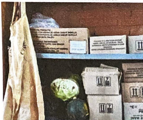
Imagen N°5 - Almacenaje improvisado de insumos Ubicación: sala de informática