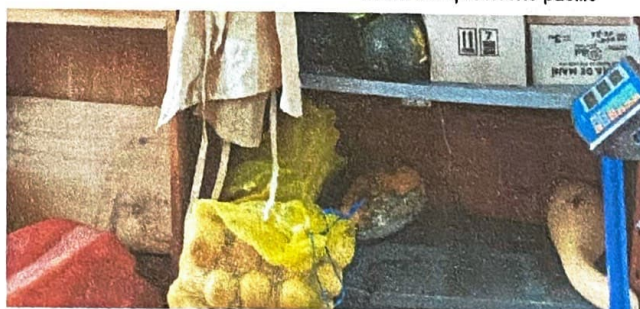
Imagen N°4- Almacenaje improvisado de insumos Ubicación: sala de informática