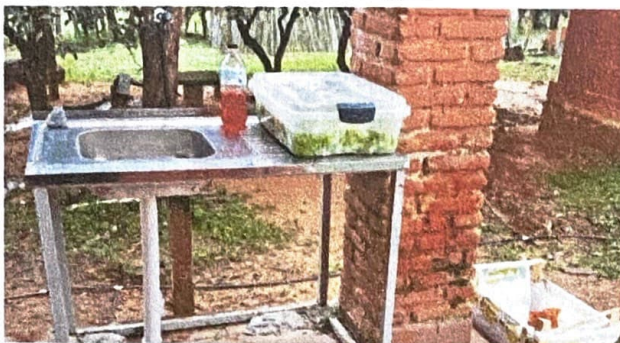
Imagen N°1 - Pileta provisoria p/ higienización de alimentos Ubicación: Pasillo exterior de la institución.