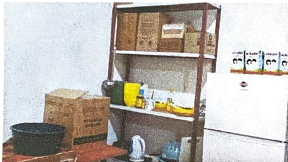
Imagen N°3 – Improvisación de cocina p/ elaboración del almuerzo y depósito Ubicación: Despacho de Dirección.