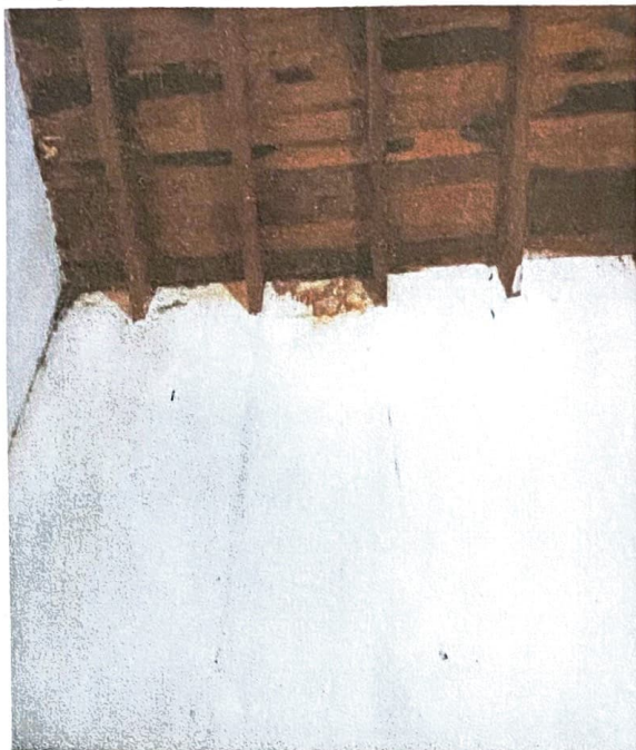
Imagen N°1 – Improvisación de espacio para elaboración del almuerzo y depósito se evidencia deterioro de techo c/ filtraciones Ubicación: Despacho de Dirección.