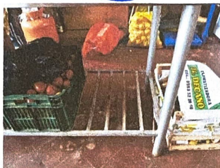
Imagen N°2 - Almacenaje de insumos. Ubicación: sala de informática