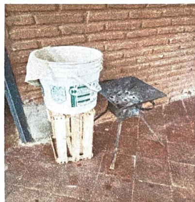
Imagen N°4: Brasero p/ cocinar mandioca p/ menú escolar Ubicación: provisorio pasillo