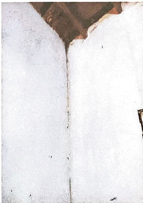
Imagen N°2 – Improvisación de espacio para elaboración del almuerzo y depósito se evidencia deterioro de pared c/ filtraciones Ubicación: Despacho de Dirección.