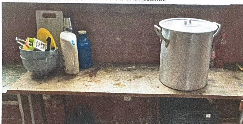
Imagen N°3 - Mesada improvisada para preparación de los alimentos Ubicación: Sala de Informática