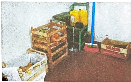
Imagen N°4 – Improvisación de espacio para depósito de insumos Ubicación: Despacho de Dirección.