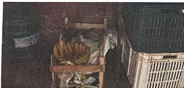
Imagen N°3 - Almacenaje improvisado de insumos Ubicación: sala de informática