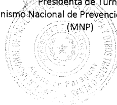
ABG. CLAUDIA PATRICIA SANABRIA Presidenta de Turno Mecanismo Nacional de Prevención de la Tortura (MNP)