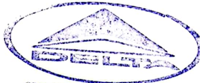
CONSTRUCTORA Y TRANSPORTE R/C 2193057-0