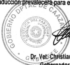
Dr. Vet. Christian Andrés Acosta Gobernador de Caazapá

El contrato, así como toda la correspondencia y documentos relativos al contrato, deberán ser escritos en idioma castellano. Los documentos de sustento y material impreso que formen parte del contrato, pueden estar redactados en otro idioma siempre que estén acompañados de una traducción realizada por traductor matriculado en la República del Paraguay, en sus partes pertinentes al idioma castellano y, en tal caso, dicha traducción prevalecerá para efectos de interpretación del contrato.