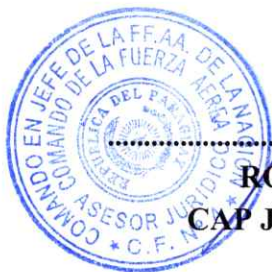
..... RODRIGO ARIEL ARZA DIAZ CAP JM - ASESOR JURÍDICO CF N° 4