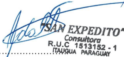
Rolando Porfirio Amarilla Servían Contratista San Expedito Consultora