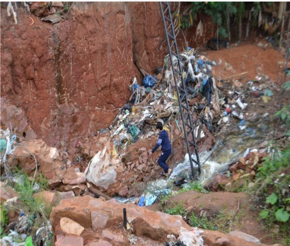
Un niño busca abrir paso para poder cruzar el arroyo Guasu de San Antonio y pasar al otro del barrio Mbocayaty