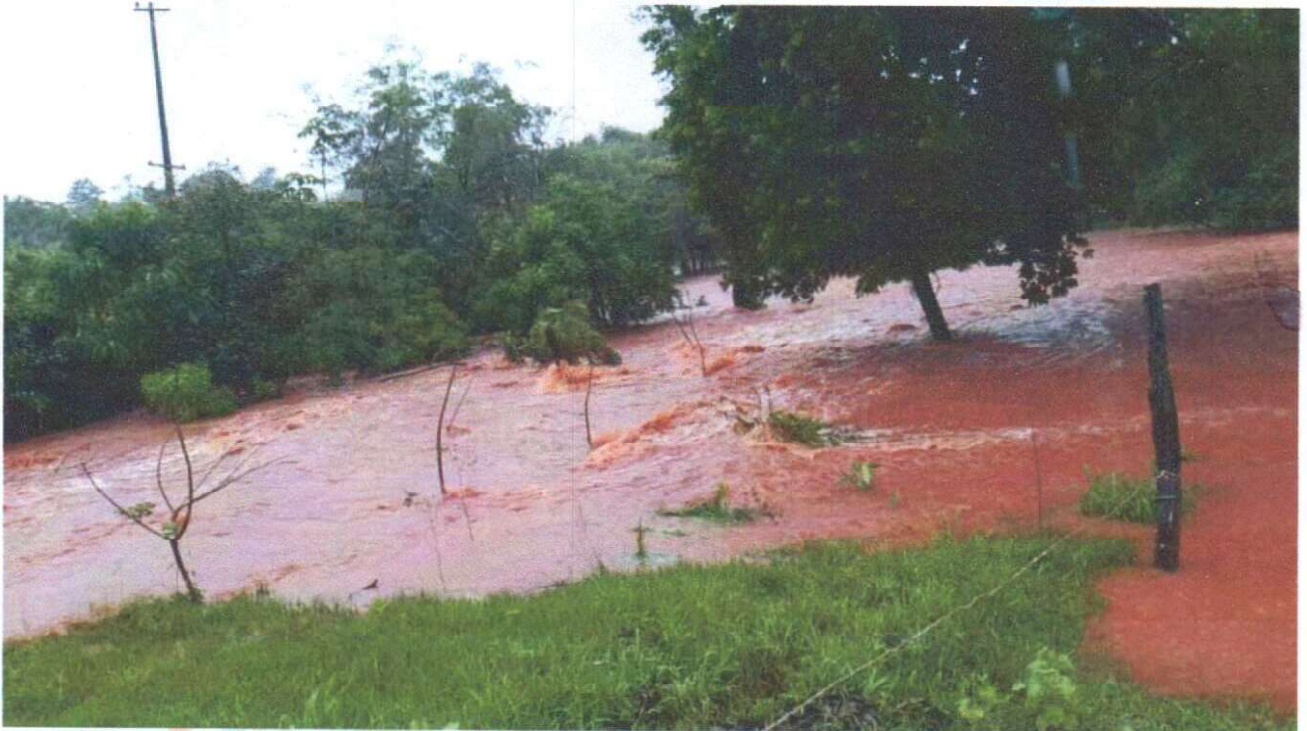
FOTO DE ESTADO TRAMO LOTE 03: CONSTRUCCION DE ALCANTARILLADO DE HORMIGON TUBULAR EN LA ZONA DENOMINADA PASO HU

“Juntos Seguiremos Construyendo el Progreso”