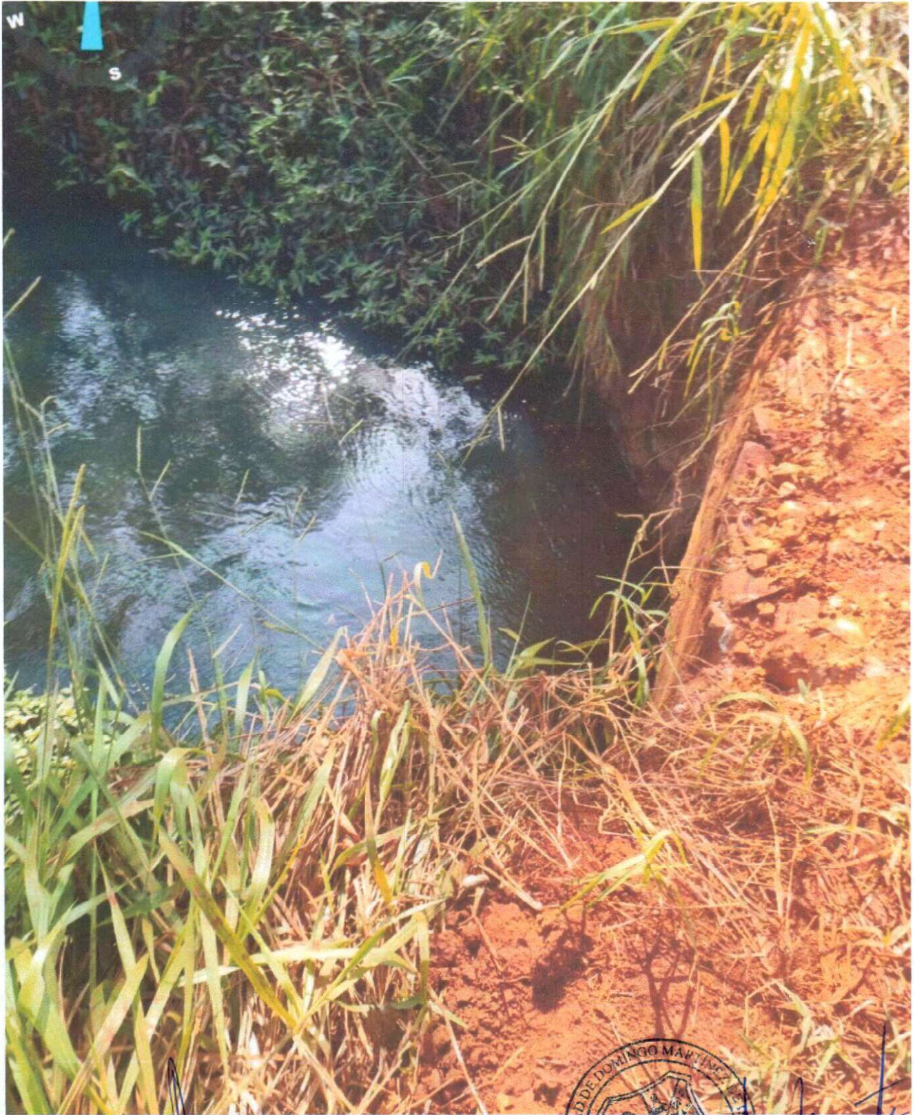
FOTO DE ESTADO TRAMO LOTE 02: CONSTRUCCION DE ALCANTARILLADO DE HORMIGON CELULAR EN LA ZONA DENOMINADA PASO HU

"Juntos Seguiremos Construyendo el Progreso"