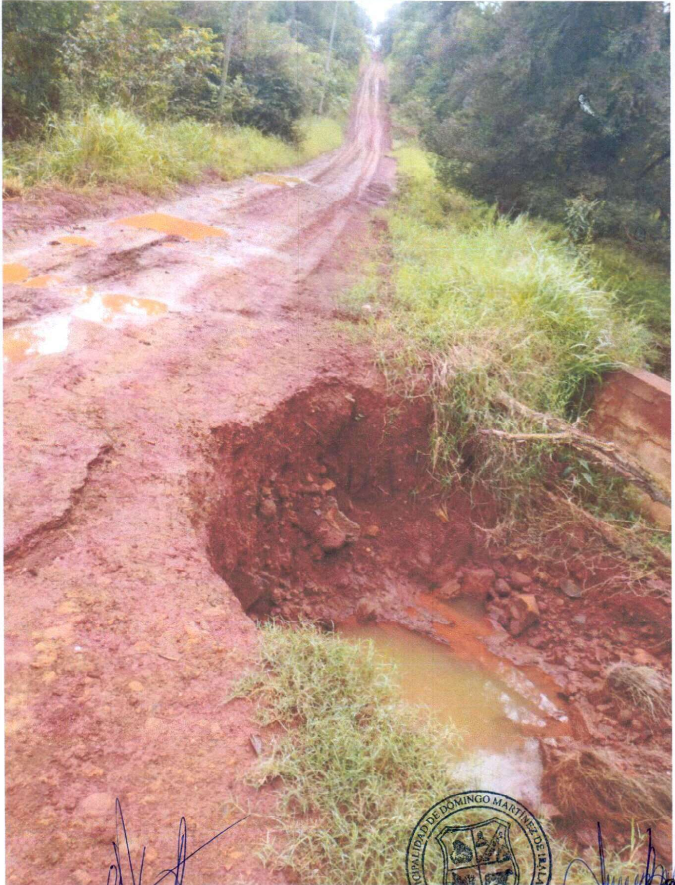
FOTO DE ESTADO LOTE 04: CONSTRUCCION DE ALCANTARILLADO DE HORMIGON TUBULAR EN LA ZONA DENOMINADA PASO HU I

"Juntos Seguiremos Construyendo el Progreso"