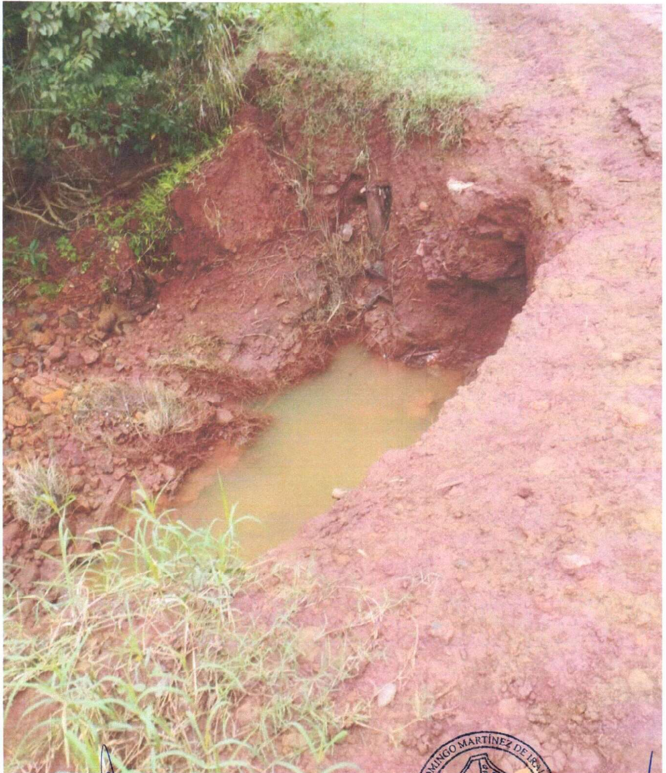
FOTO DE ESTADO TRAMO LOTE 01: CONSTRUCCION DE ALCANTARILLADO DE HORMIGON CELULAR EN LA ZONA DENOMINADA ITUTI

"Juntos Seguiremos Construyendo el Progreso"