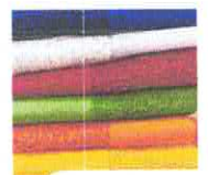
Escribidos LORENA CREACIONES