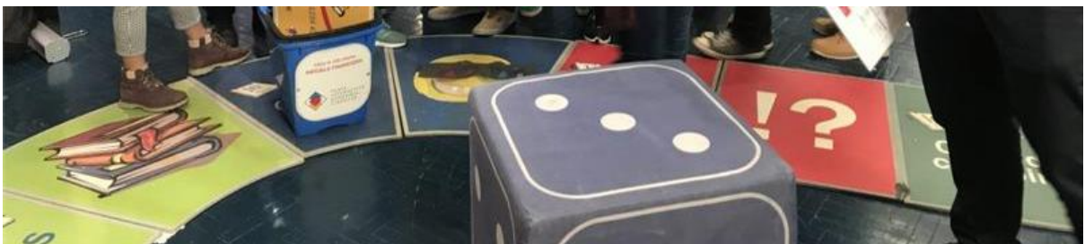
Imagen de referencia 3.