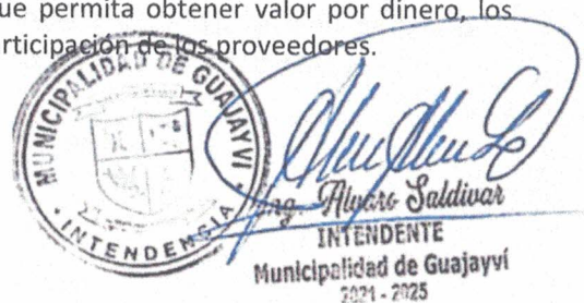
Intendente Municipalidad de Guajayvi 2021 - 2025