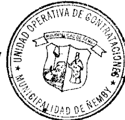
Abg. Belén Figueredo Responsable de la UOC Municipalidad de Ñemby

Por tanto, con base a lo expuesto, esta Unidad concluye que el precio promedio establecido en el presente proceso se adecua a lo establecido en el Art. 2° de la Resolución DNCP N° 454/2024.