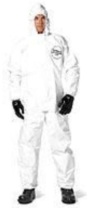
ACCESORIO (FIGURA 2)