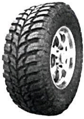
Pase el mouse para ampliar