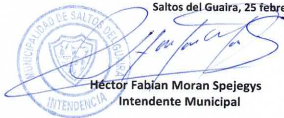
Héctor Fabían Moran Spejegys Intendente Municipal