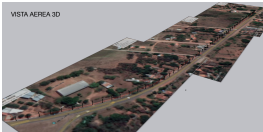
VISTA AEREA 3D

A handwritten signature in black ink, appearing to read "Nicolás Duarte Colmán".