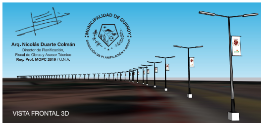
VISTA FRONTAL 3D