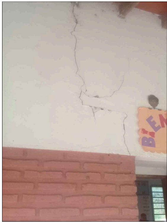
FISURAS EN LAS PAREDES