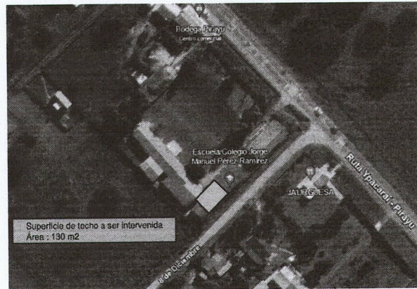
PLANTA DE UBICACION 25°27'32"S 57°16'10"W