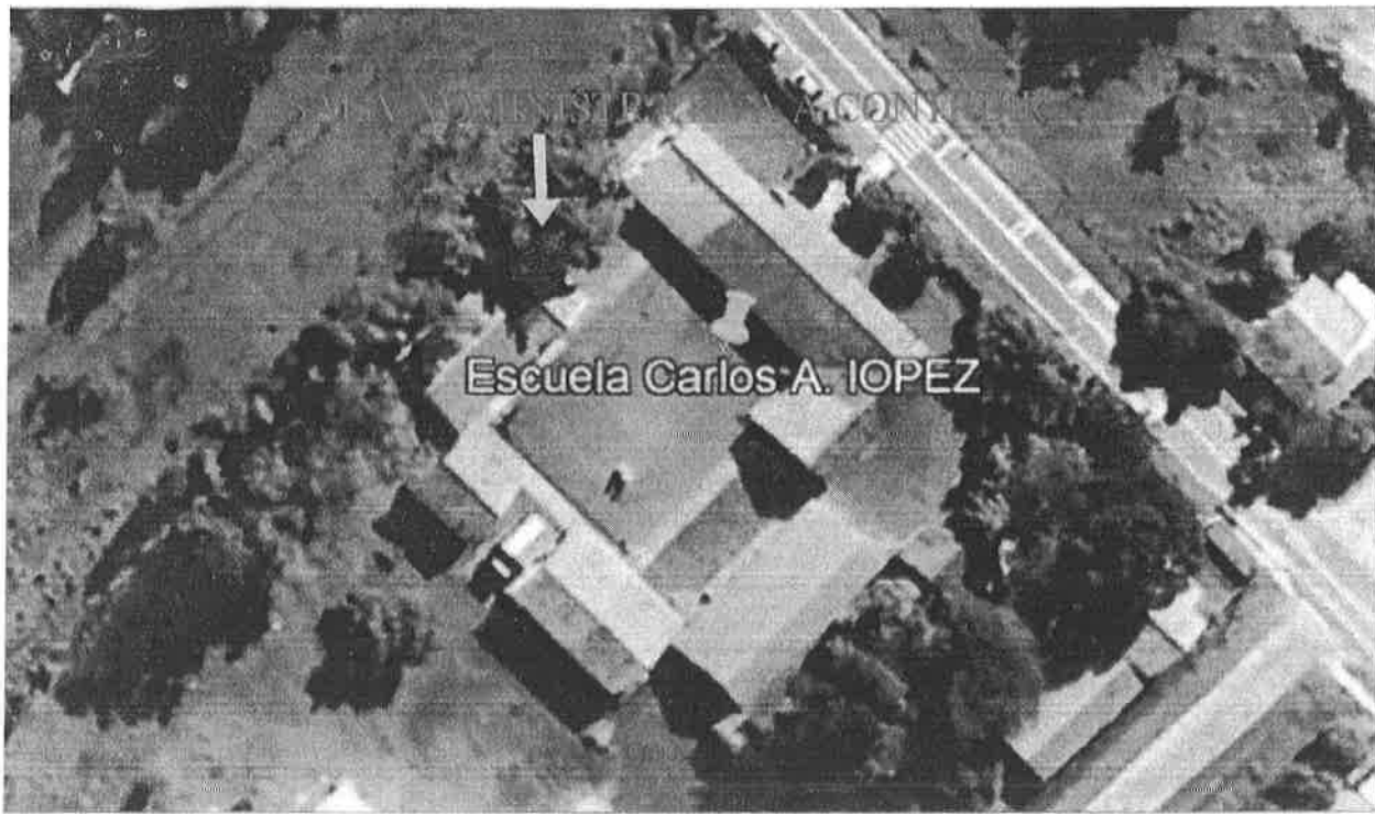
Escuela Carlos A. IOPEZ