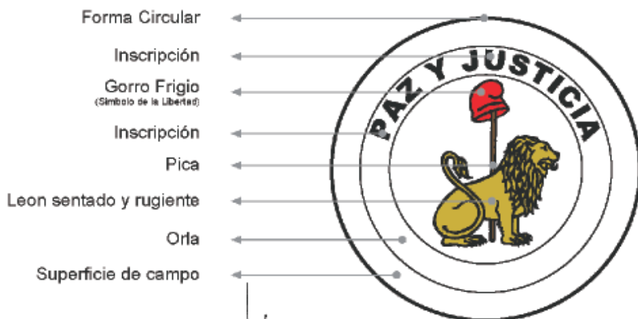
Escudo de la República Reverso