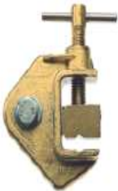
Fig. 2 Grampa de tierra