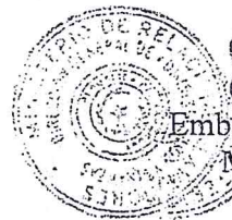
Embajador Víctor Verdún Ministro Sustituto

Hago propicia la ocasión para saludar a Vuestra Excelencia con mi distinguida consideración.