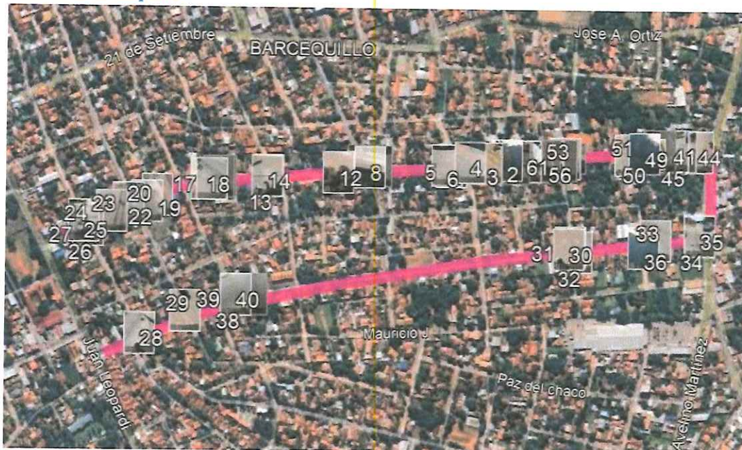
Recorrido y Georreferenciación de Puntos de Intervención Barrio Barcequillo.

Visión "Convertir a San Lorenzo del campo grande en una ciudad modelo en cuanto a desarrollo urbanístico social y cultural aplicando los valores éticos y morales para lograr la igualdad de oportunidades apostando la innovación"