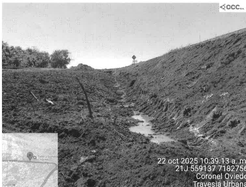
Ilustración 4 Naciente ubicado en la Prog 3+050 Longitudinal a la calzada actual y proyectada.

Manuel Domínguez 1057 - Tel. 492.913 - 202.001 - Fax: 201.042 E-MAIL: ccc@cccsa.com.py .Asunción - Paraguay