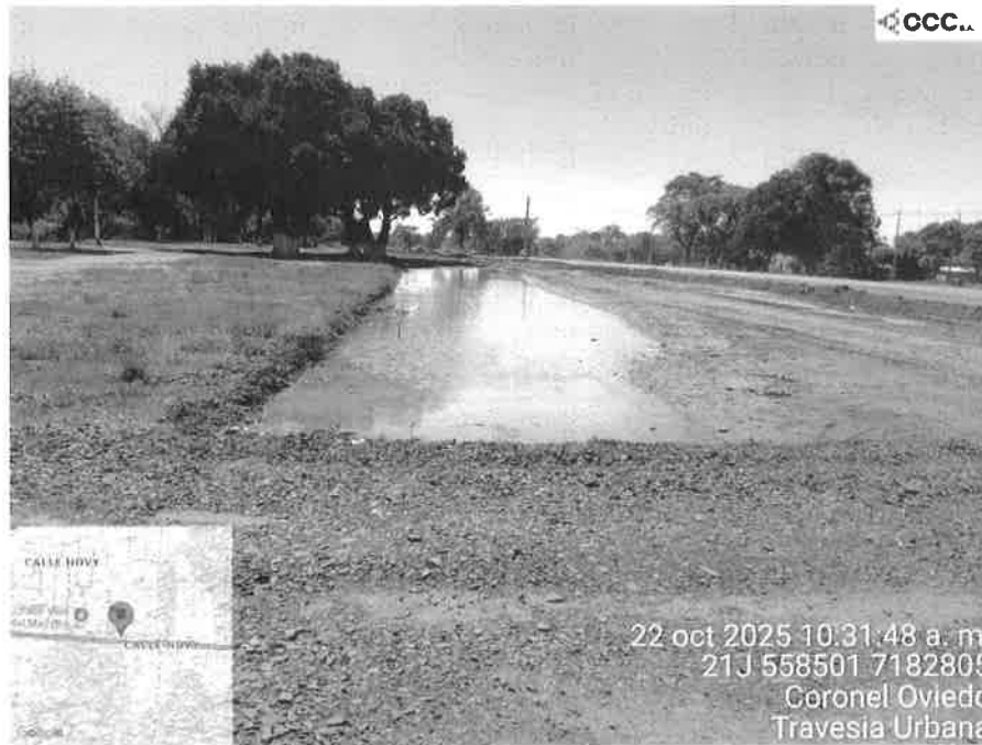
Ilustración 3 Corte para la ejecución de Paquete Estructural. Prog 2+150. Tomadas 4 días después de la precipitación ocurrida en fecha 18-10-2025.