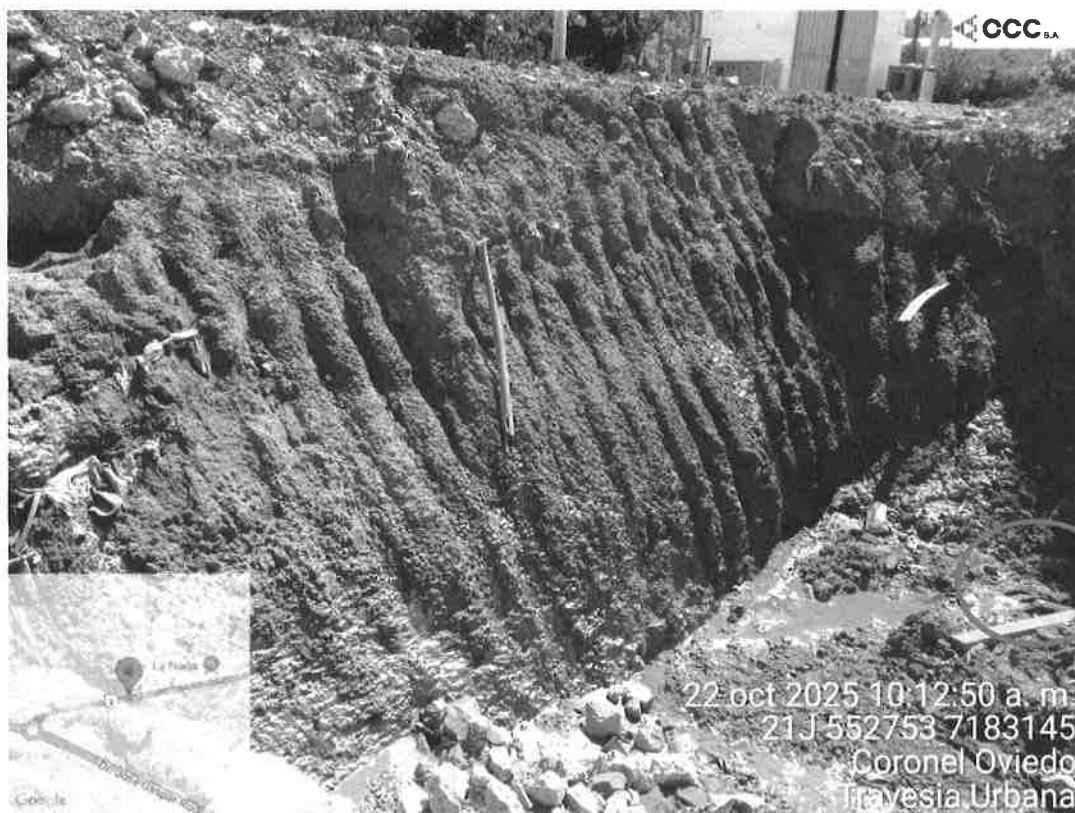
Ilustración 1 Excavación para colocación y alcantarillas Zona Troncal Prog. 0+400

nacientes activas que aportan un caudal constante de agua subterránea hacia la zona de intervención. Esta situación se puede observar en Ilustración 1, en una excavación realizada para colocación de alcantarilla, que el nivel freático se encuentra a escasos metros del nivel superficial.